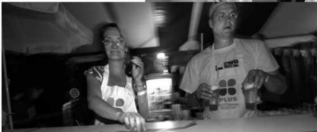
... en ook wat te drinken.