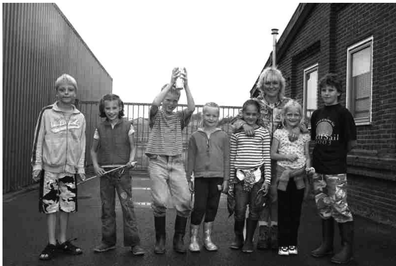
Het winnende team van de survivaltocht

De kindermiddag tijdens de feestweek op woensdag 14 juni was een groot succes, maar liefst 115 kinderen deden mee. Het programma voor de peuters en de kleuters was bij de feesttent, de andere kinderen hebben een survivalmiddag gehad die bij de haven begon en eindigde.