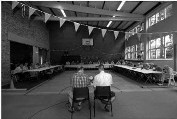
Bingo en jeu de boules...