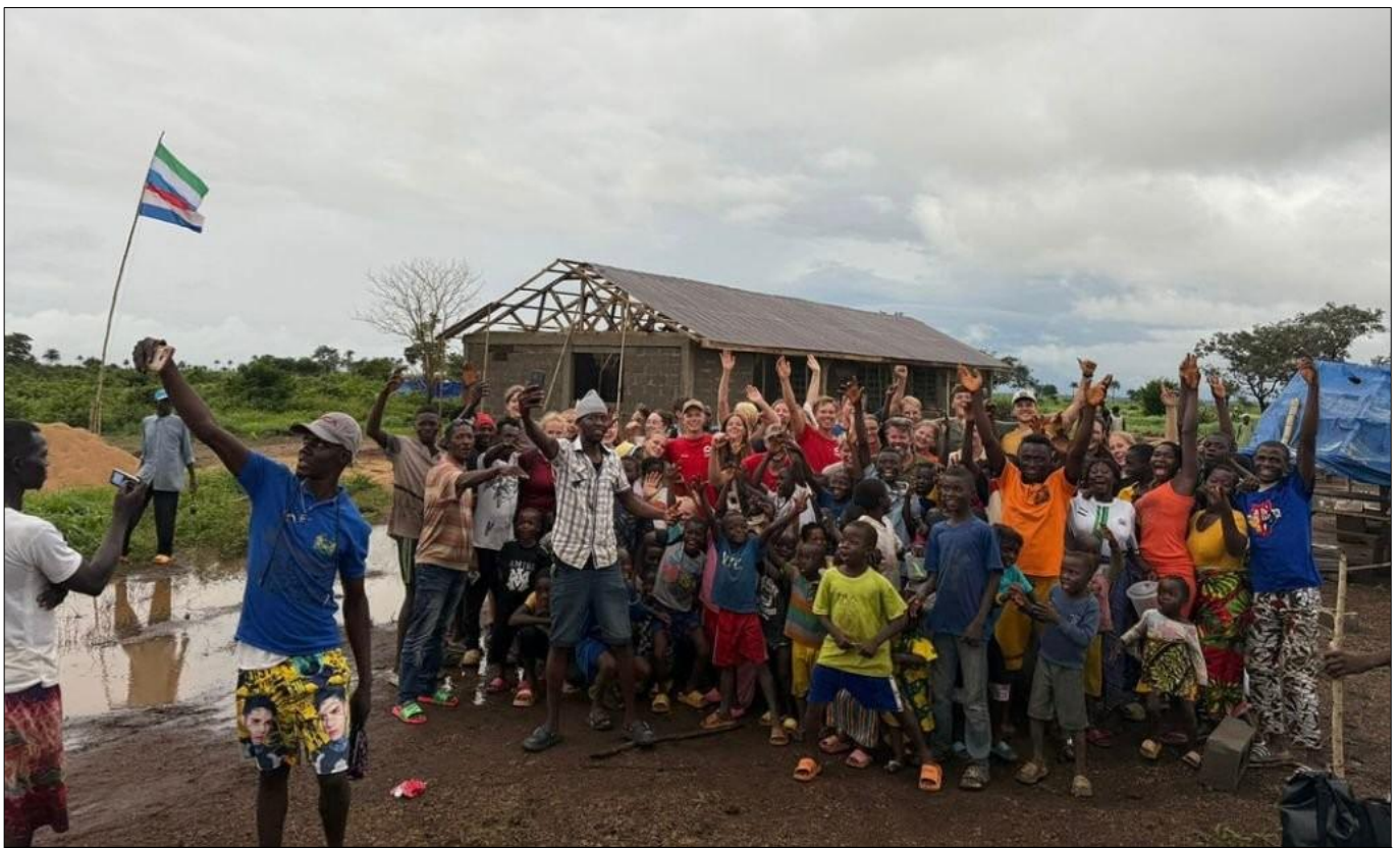
Op de foto: de school die gebouwd is.

De reis begon op de nacht van 15 juli en duurde tot 4 augustus. Wat een tijd heb ik daar gehad! Het was een lange reis om ernaar toe te gaan maar het was het waard. We werden met veel vreugde en dankbaarheid ontvangen in het dorp Kawonsor met gedans en liederen. Die dag was het begin van de mooie tijd die we daar mochten hebben. Van maandag tot vrijdag gingen we altijd bouwen en in het weekend hadden we cultuuruitjes, zodat we natuurlijk ook de natuur konden zien en hoe de cultuur eruitziet. En op de zondag natuurlijk naar de kerk, dit was bijzonder om te zien want de kerk was maar een overkapping met bankjes. Dit is omdat hun "kerkgebouw" in was gestort door een grote regenbui. Zo zie je al in wat voor armoede ze leven.