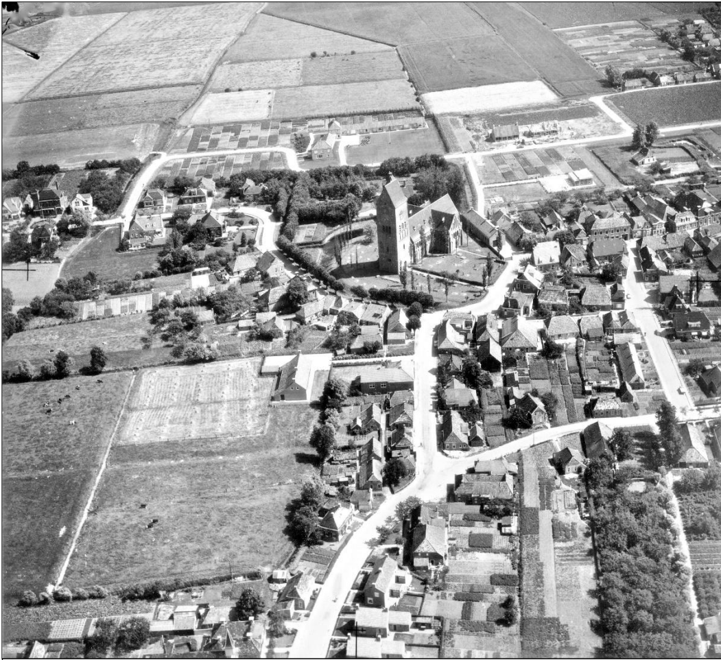
(Luchtfoto Stedum in 1958,)