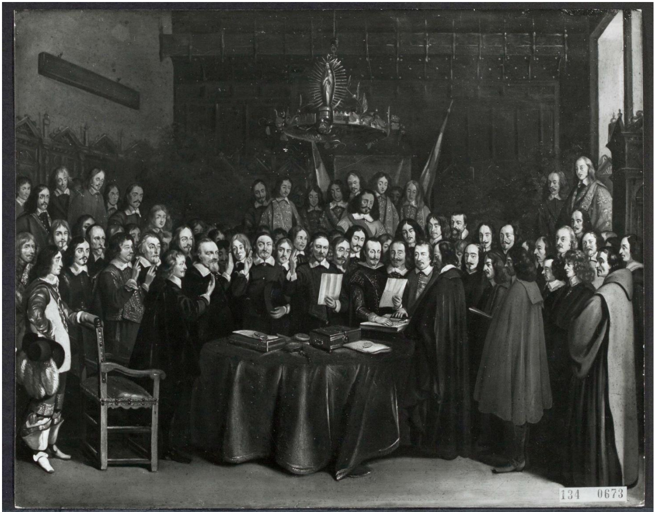
(op de foto: Schilderij Vrede van Münster,)

Op 15 mei 1648 wordt in het raadhuis van Münster de vrede gesloten tussen de Zeven Verenigde Nederlanden en Spanje. De zes Nederlandse heren v.l.n.r. zijn Willem van Ripperda (Overijssel), Frans van Donia (Friesland), Adriaan Clant (Groningen, Stad en Ommelanden), Adriaan Pauw en Jan van Mathenesse (Holland) en Barthold van Gent (Gelderland), die de Nederlandse tekst omhoog houdt. De Utrechtse gezant ontbreekt wegens ziekte. Rechts heeft de Spaanse Graaf van Peñeranda zijn hand op de bijbel en het kruis. Rechts daarvan houdt Johannes Cuermans de Spaanse tekst omhoog.