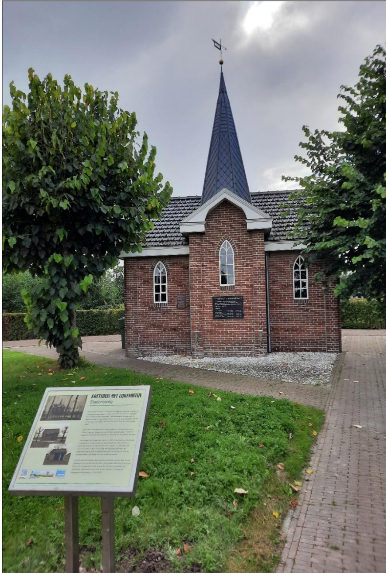
(op de foto: Koets- en lijkenhuisje met informatiebord.)

Zaterdag 13 september is Open Monumentendag gehouden in Stedum. De Bartholomeüskerk was geopend, evenals de Vlasschuur, het Rabobankmuseum, de Occo Reintiesheerd en Historie Stedum met het Koets- en lijkenhuisje. Vanwege versterking was de bijschuur van Niehof - waarin het Sien Jensema museum - niet geopend.