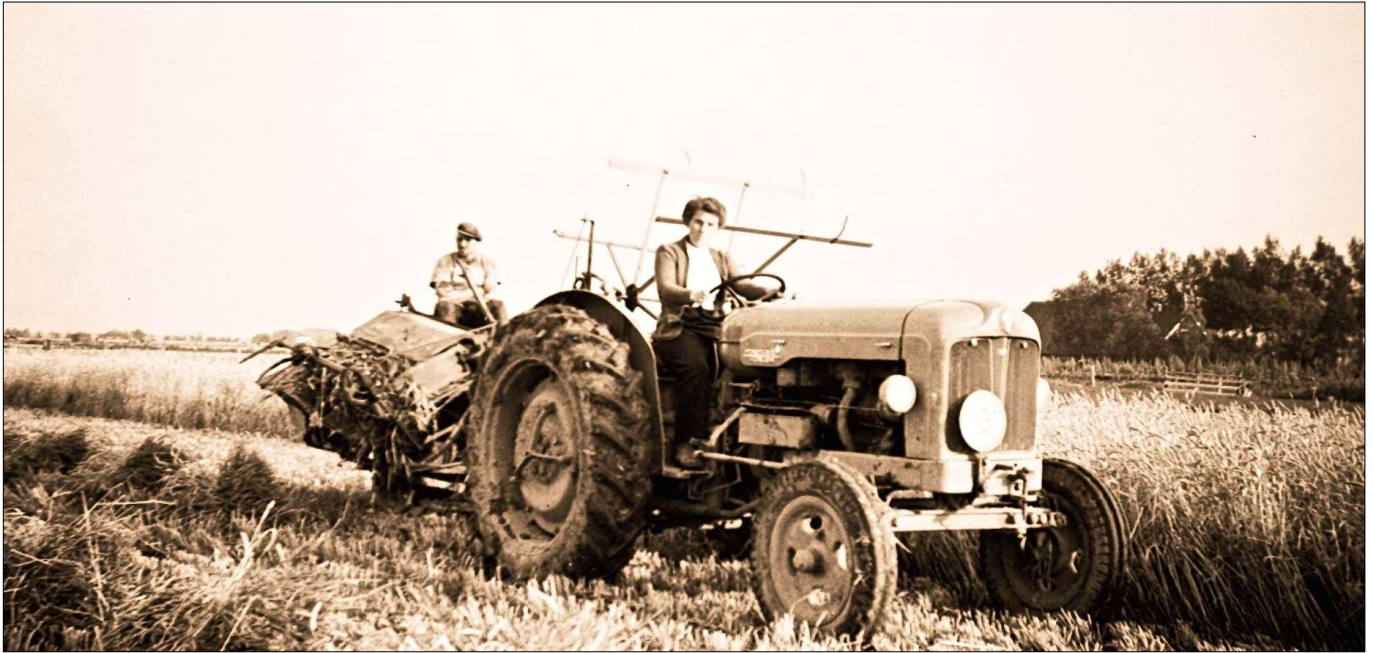
Foto van vroeger