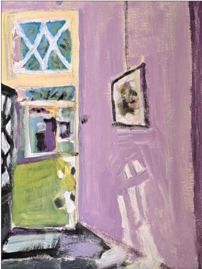
De kunstenaarsgroep Stedum