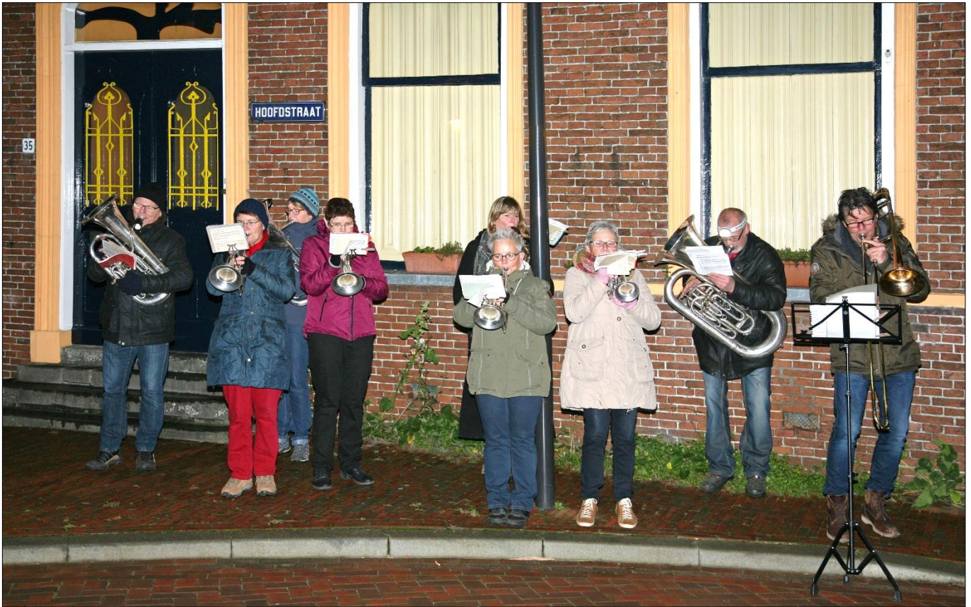
Foto van vroeger