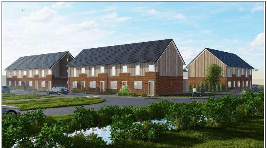
(Impressie nieuwbouwwoningen Stedum)

veel mogelijk buiten schooltijden plaats en het vrachtverkeer wordt zo veel mogelijk binnen de bouwhekken opgesteld.