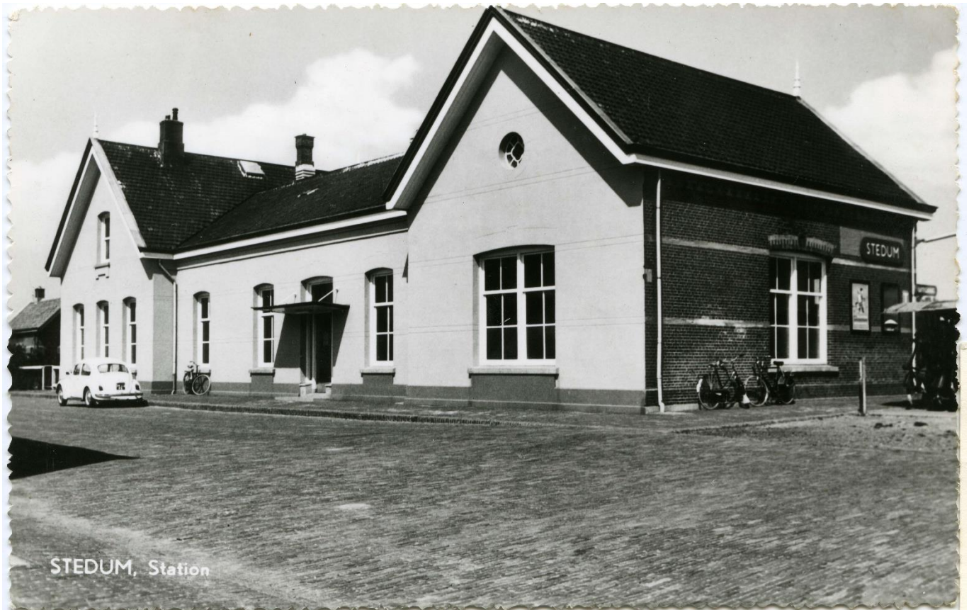
(Ansichtkaart Station Stedum kort voor de afbraak)

Het station van is geopend op 15 juni 1884, afgebroken in 1973 en vervangen door een abri. Het spoor werd tot 1999 geëxploiteerd door de Nederlandse Spoorwegen. In de begintijd reden er vijf treinen per dag van Groningen naar Delfzijl en terug. Behalve stations waren er toen verschillende haltes, zoals de halte Middelstum halverwege Bedum en Stedum. De Halteweg herinnert daar nog aan.