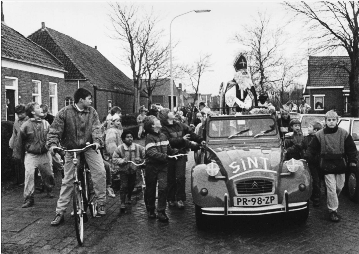
(Intocht van Sinterklaas 21 november 1992)

Sinterklaas is weer in het land. Hij is aangekomen in de haven en nu in de Triesenbergstraat. De boot werd verwisseld voor een lelijke eend, of deux chevaux. Even later is hij gefotografeerd op zijn schimmel bij de kerk.