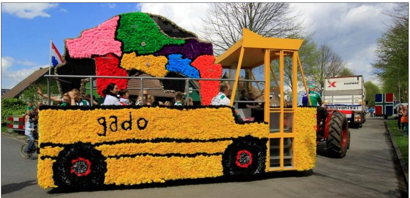
(op de foto de winnaar van de optocht in 2015)

De contactpersonen van iedere straat hebben een formulier ontvangen om in overleg te gaan met hun bewoners omtrent het meedoen aan de optocht. Graag zien wij de contactpersonen ook terug op de jaarvergadering van 19 november. Tijdens de jaarvergadering zullen er ook beelden worden vertoond van de eerdere optochten en zal het Thema Oud/Nieuw bekend worden gemaakt van de Optocht. Een ieder is van harte welkom.