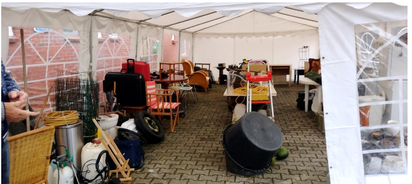
(een impressie van de rommelmarkt van 2023)