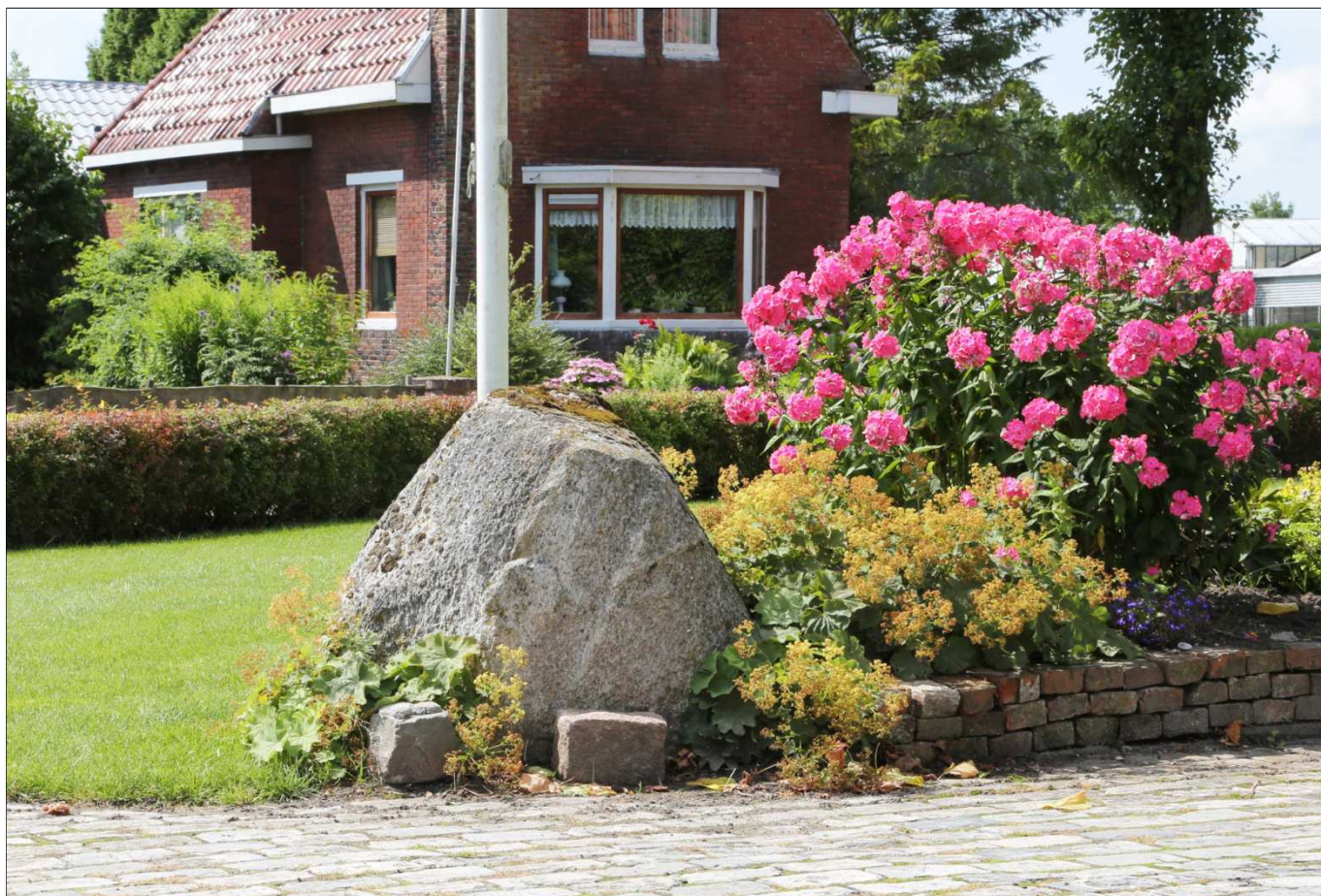
(foto boven: Steen bij Hofman – Molenstraat, foto onder: Stenen Richtploatske)