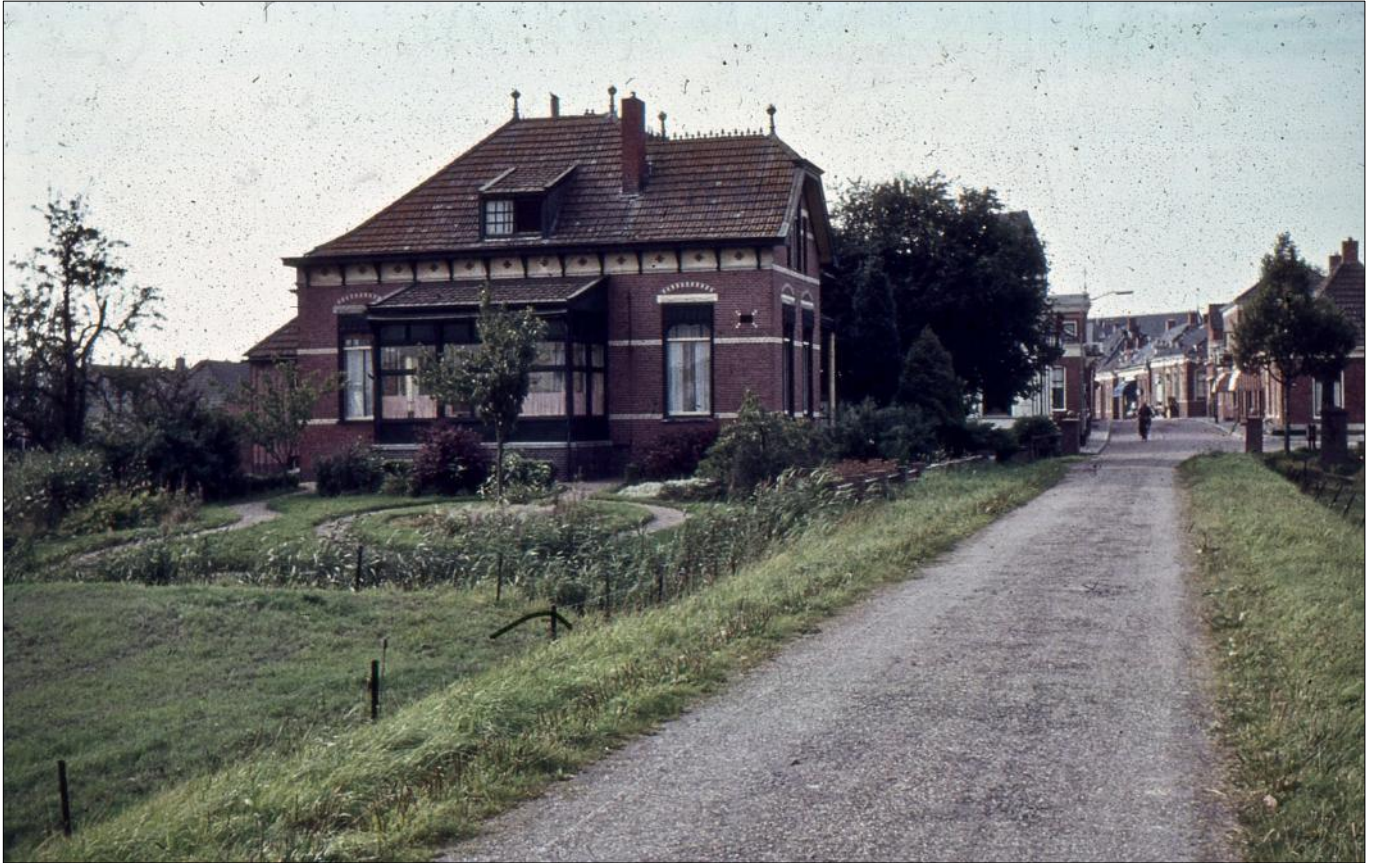
(Hoofdstraat 40, foto: Wim Leseman 1960 – 1970)

Hoofdstraat 40 staat bekend als burgemeesterswoning. Het herenhuis is gebouwd in opdracht van Joh. Jensema. Het ontwerp is van de vermaarde architect Oeds de Leeuw Wieland (1839 -1919) en is in 1909 aanbesteed voor f 6.798,=. De aannemer was E. Wiersema te Zandweer 1 .