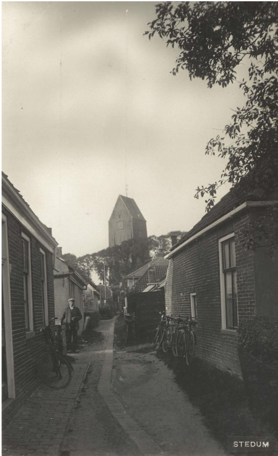
(op de foto: 'Synagogegang' Krangeweesterpad 1910)

Het Krangeweesterpad heette in de volksmond Synagogegang. Het liep vlak achter de huizen langs aan het begin van de Bedumerweg naar de Campsterstraat, die nu Kampweg heet. Op de hoek van de Bedumerweg en de D. Triezenbergstraat stond de synagoge. Het pad is verdwenen en de huizen zijn gesloopt. Het laatste huis was op het laatst in gebruik als 'Duivenhuisje'. De grond is bij de woningen Bedumerweg 10, 12 en 14 gevoegd. Op de kadastrale kaart zijn het pad en de percelen nog herkenbaar.