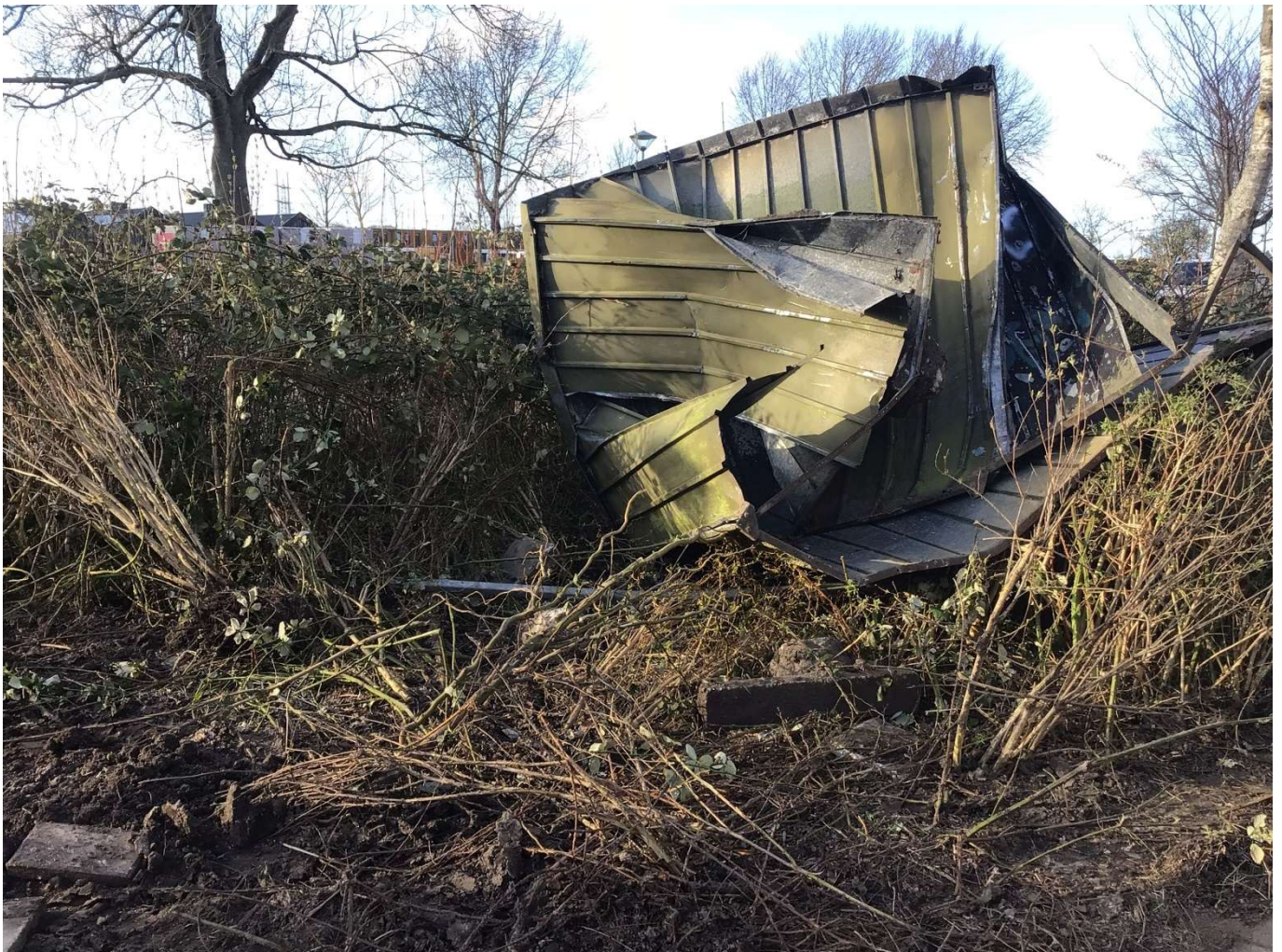
(op de foto: kapot schuurtje aan de Weemweg.)