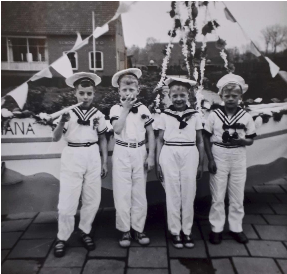
(Bevrijding 1958)

Dit jaar 2025 is het tachtig jaar geleden dat Nederland bevrijd werd en er een einde kwam aan de Tweede Wereldoorlog.