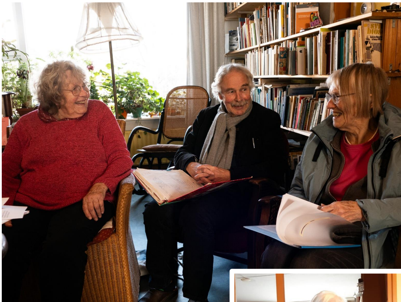
(Op de foto's de leden van het zangkoor.)