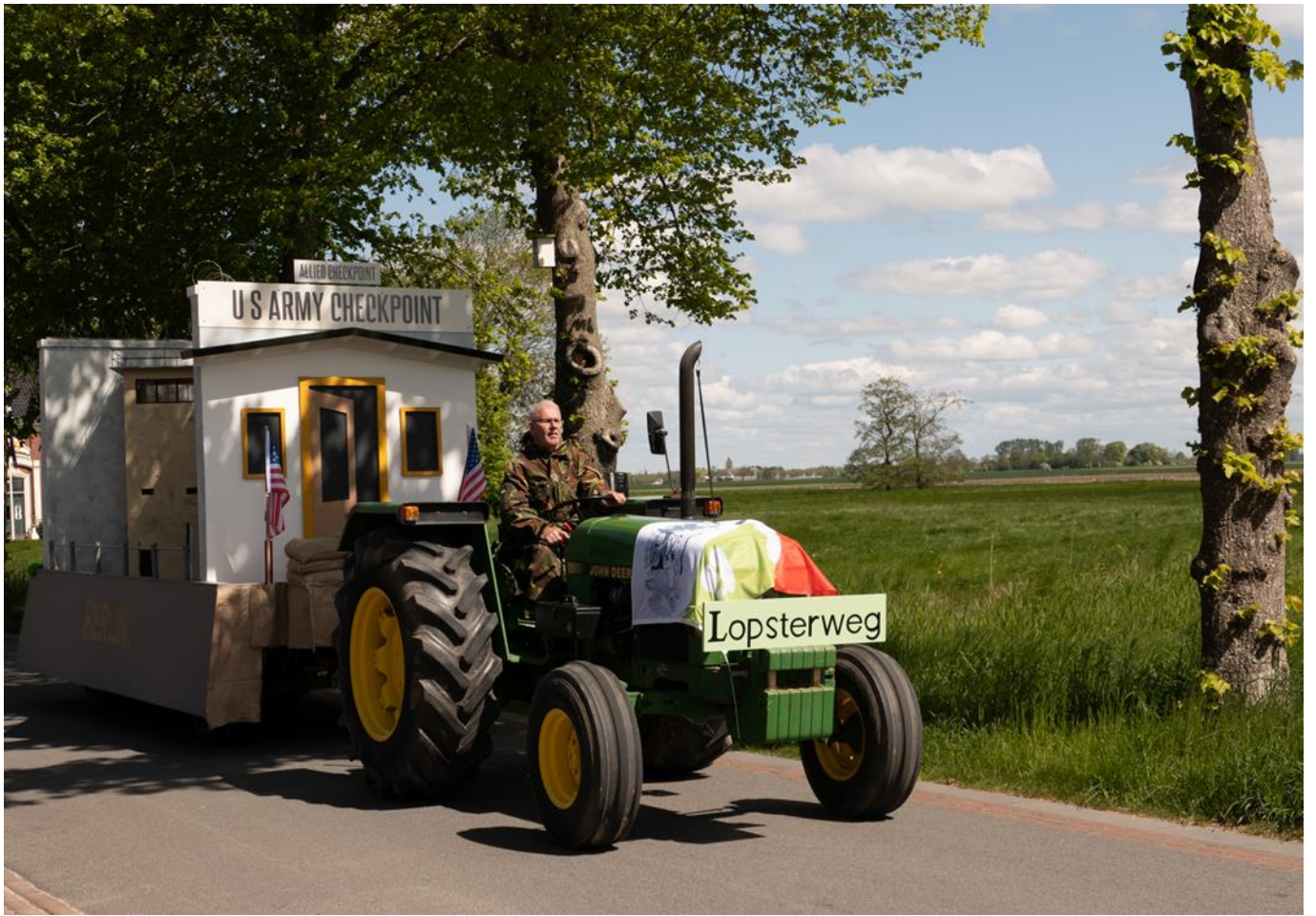
(Op de foto's de winnende wagen van de Lopsterweg. De foto's zijn gemaakt door Lydia Brookman)