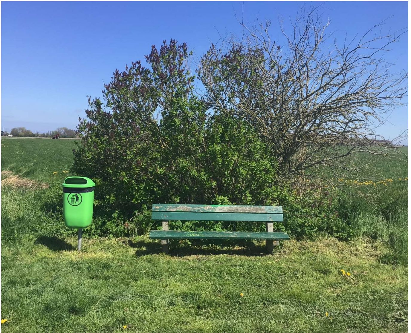
(Op de foto: bankje bij het Kleipad richting de Heemen.)