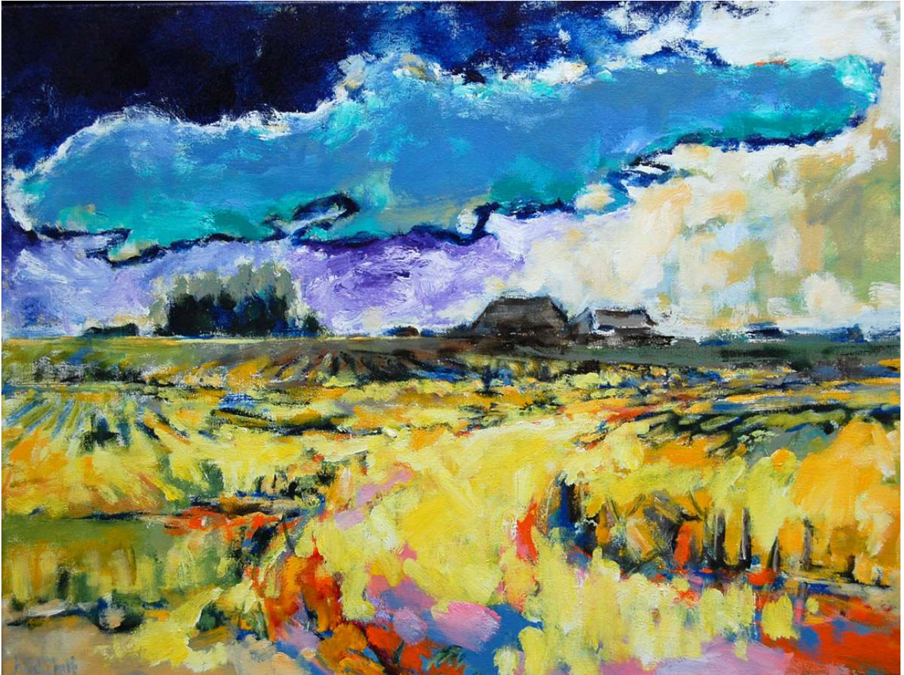
(boven: 'eind april' van Huib van der Stelt, onder een werk van Birgitta Precht!)