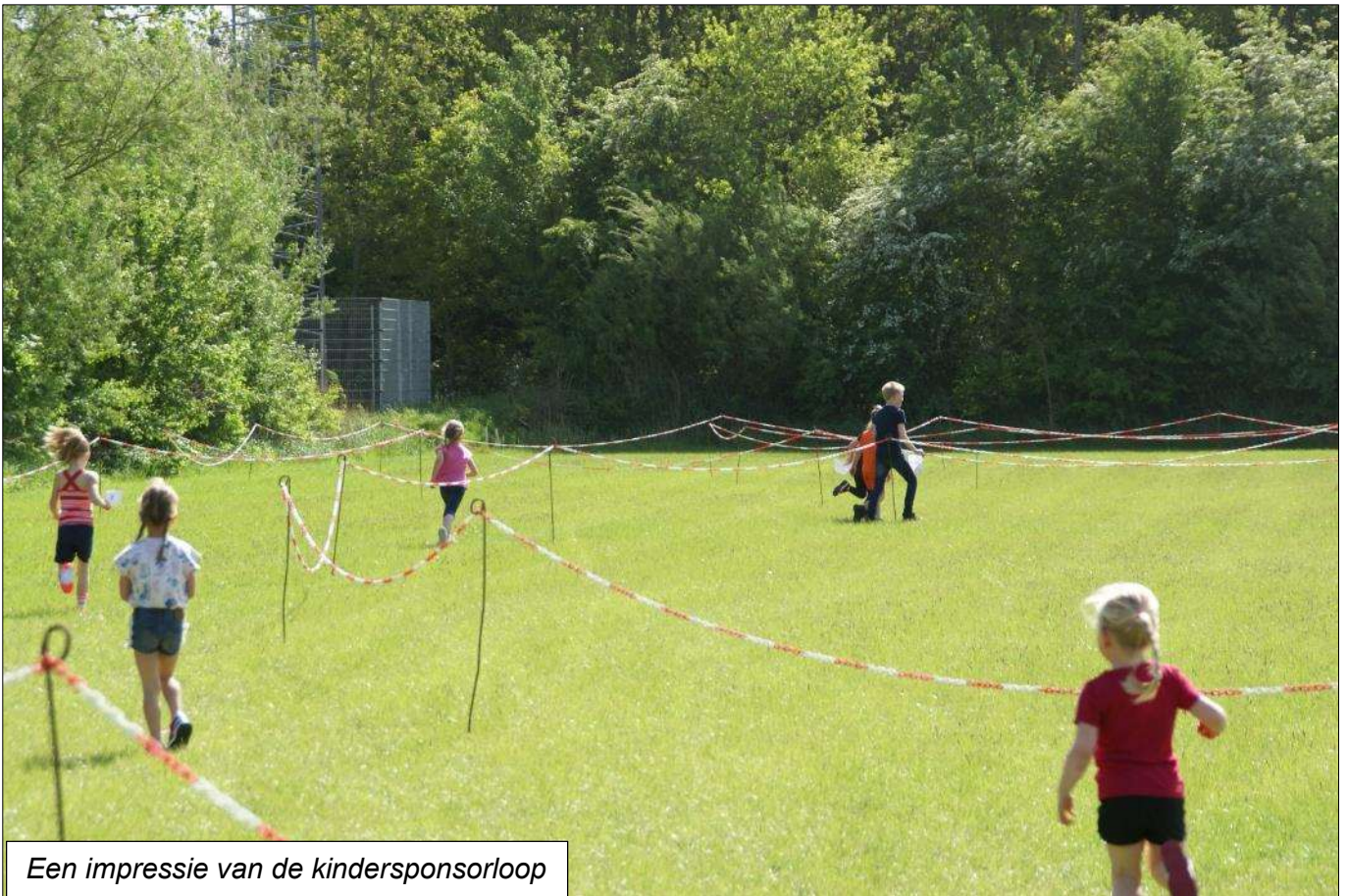
Een impressie van de kindersponsorloop

Vooraf aan de loop ging de basisschool De Klaver van start met een sponsorloop t.b.v. Oekraïne. Aangemoedigd door het vele publiek, vaders, moeders, opa's en oma's liepen ze een kwartier zoveel mogelijk rondjes voor een vast bedrag of per ronde. Na afloop was er een medaille en drinken als beloning.