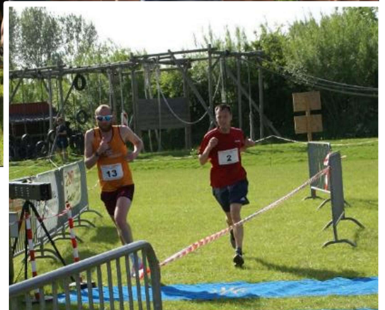
Bij de doorkomst na 5 km lopen de latere nummers 1 en 2 al op kop.