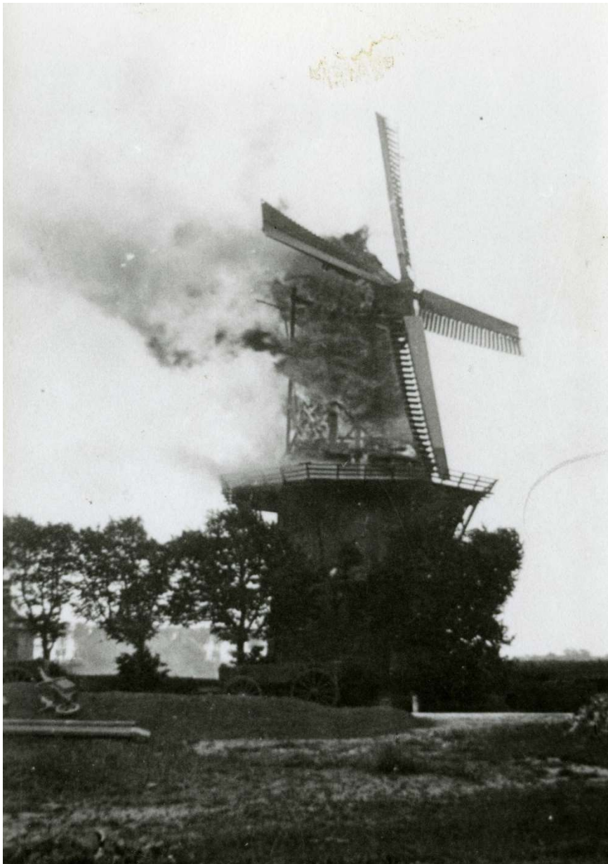
op de foto: molen De Zilvermeeuw in brand

Het is zondagmorgen 5 juli 1936. Het anders zo rustige Stedum is in rep en roer. Molen De Zilvermeeuw staat in brand.