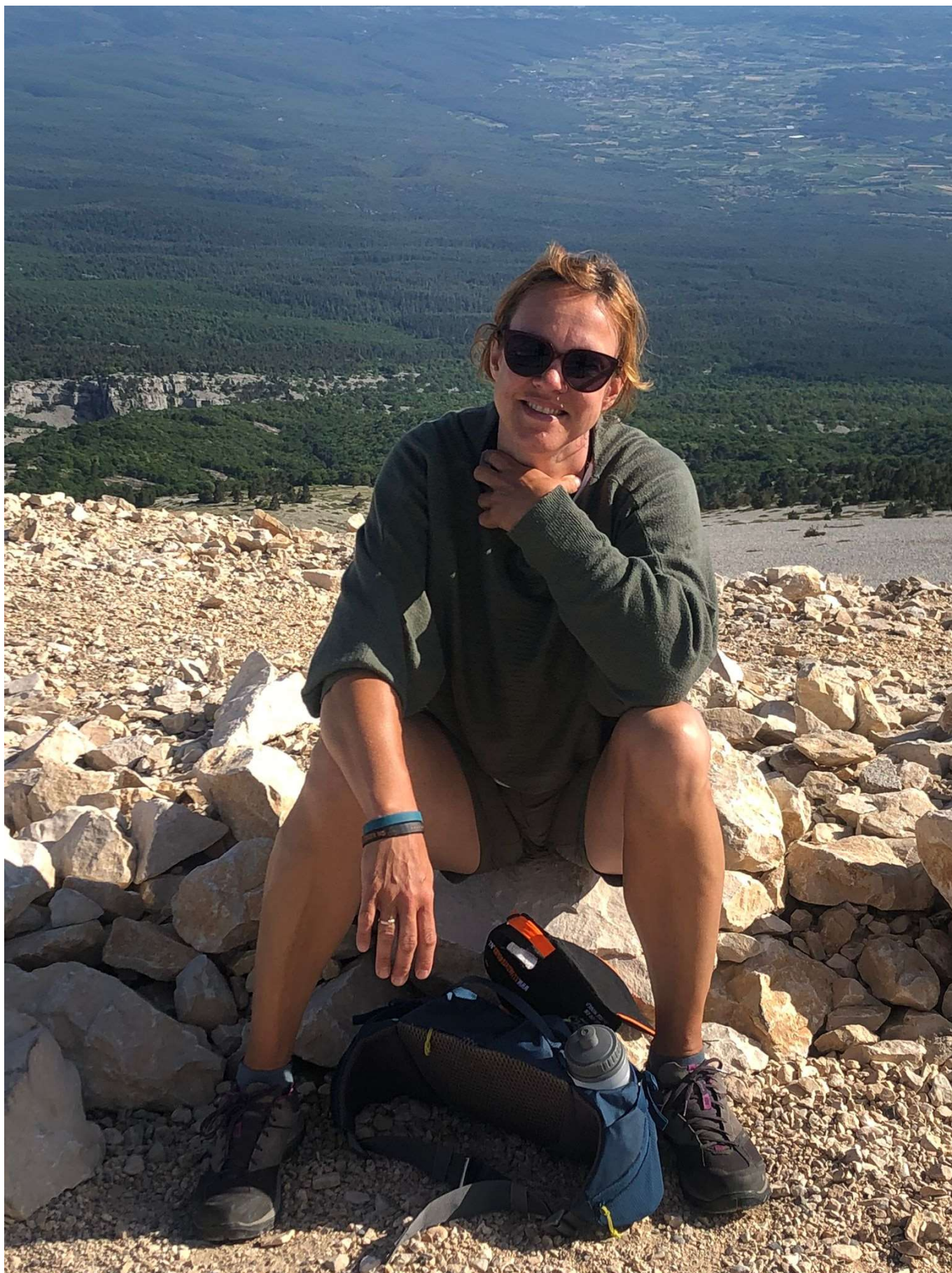
(Mont Ventoux. Dit was na de beklimming tegen de avond, wachtend op een taxi om weer naar beneden te gaan.)