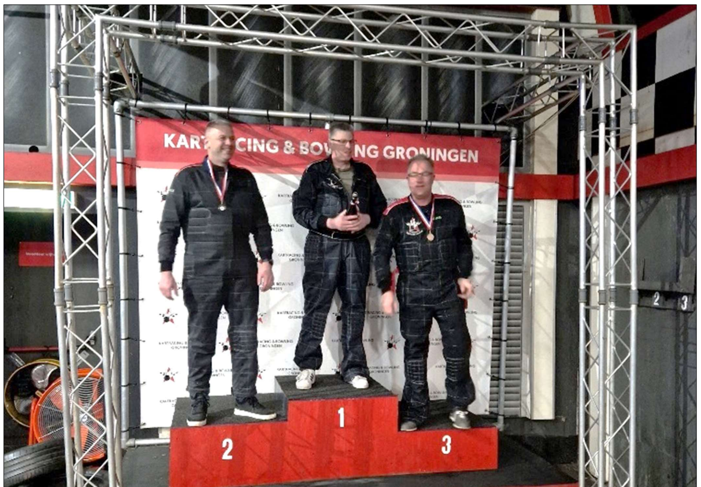
Enkele foto's van de ALV van Wielervereniging Oet Steem