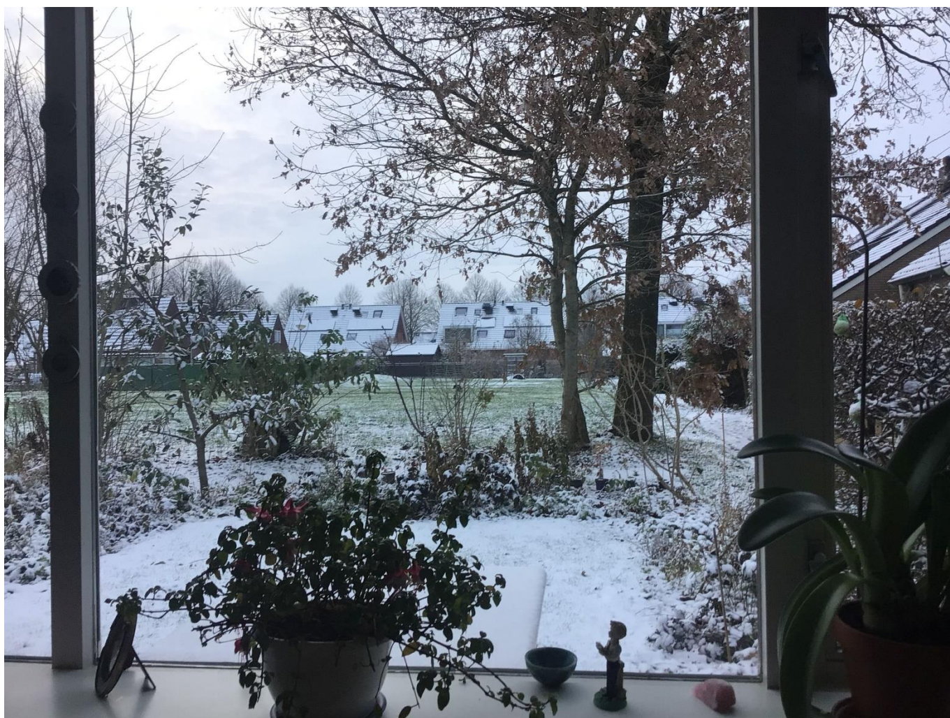
(op de foto: uitzicht huiskamer in Stedum.)