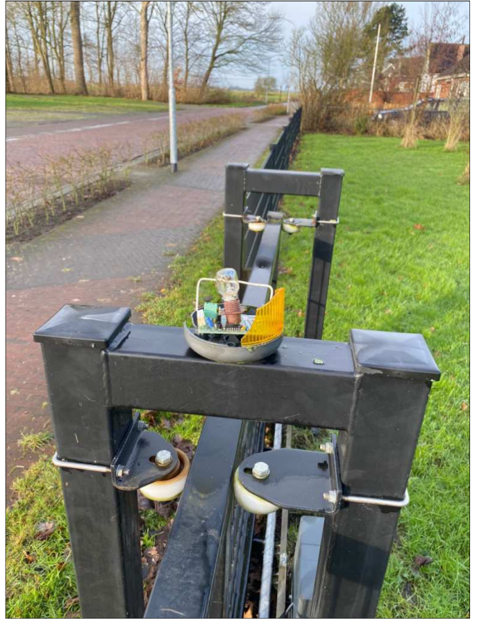
de vernielde lamp aan de Stationsstraat