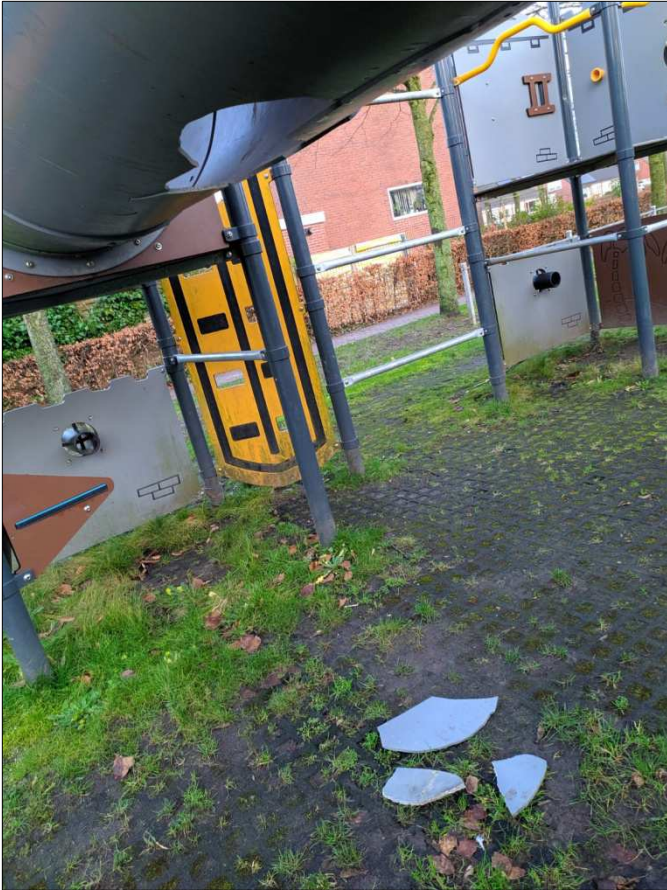
de kapotte kruipbuis van het grote speeltoestel