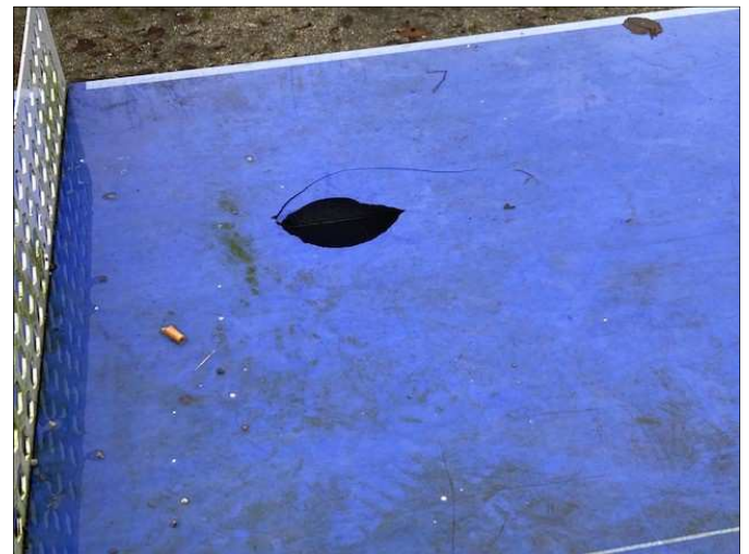
de vernielingen aan de tafeltennistafel